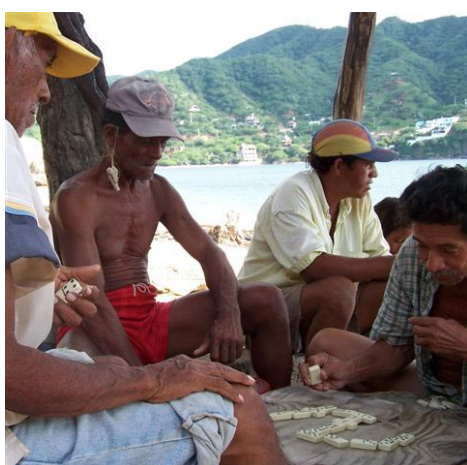
Bahía de Taganga.

Las convocatorias se publicarán en el Portafolio de Convocatorias 2007 del Ministerio de Cultura. Se abrirán el 15 de enero de 2007 y se cerrarán el 30 de julio del mismo año. Para mayores informes consultar: www.mincultura.gov.co