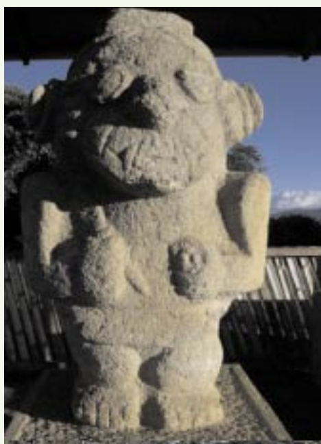
Terraplén central. Parque arqueológico Alto de los Ídolos. Isnos, Huila.

Del 16 al 18 de noviembre se realizó en el Museo Nacional, el Seminario "Museos Educación y Juventud", en el cual participaron conferencistas de México, Brasil, Argentina, Costa Rica, Canadá, Ecuador y Colombia. Tras tres días de reflexión quedaron dos ideas en el aire: que los museos latinoamericanos están en sintonía y que en vez de envejecer, rejuvenecen. En el 2007 la Universidad Externado publicará las memorias.