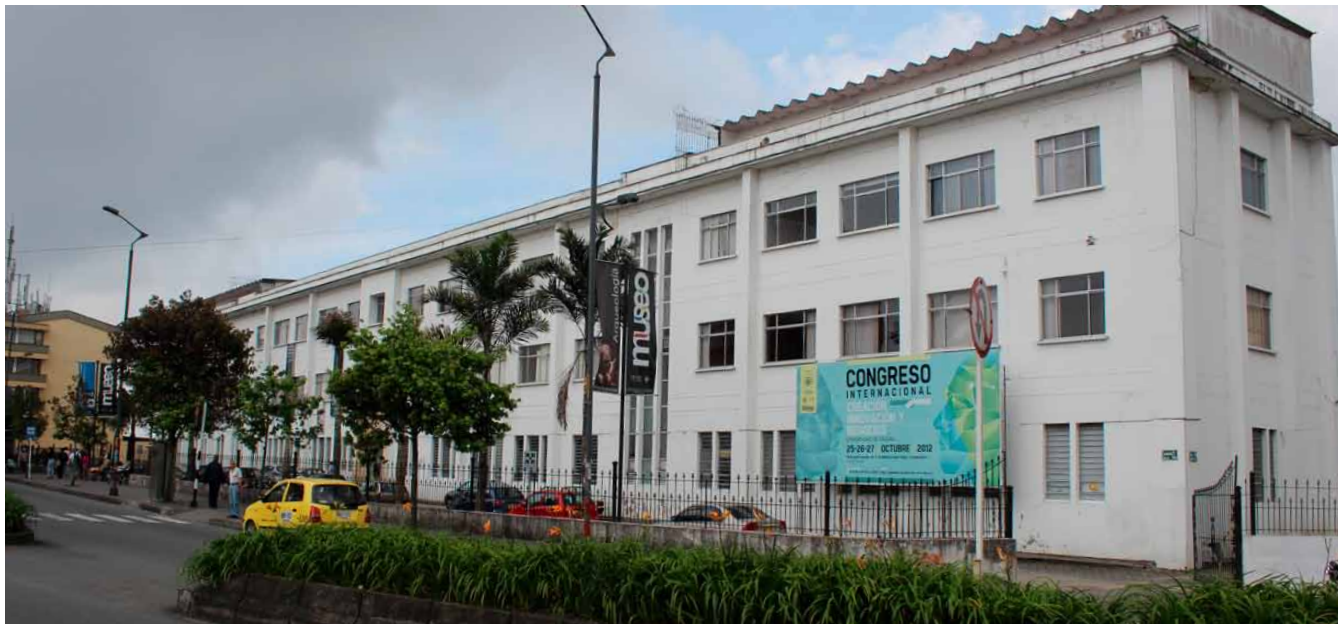
Fachada del Museo

Las rocas ígneas, sedimentarias y metamórficas, y los minerales se caracterizan por su gran belleza, valor ornamental o económico. Entre las rocas de Colombia, se encuentran algunas con una antigüedad aproximada de 1800 millones de años (Granulitas y Gneises de Garzón y la Sierra Nevada de Santa Marta).