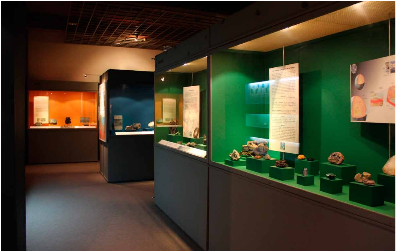
Sala de Geología y Paleontología