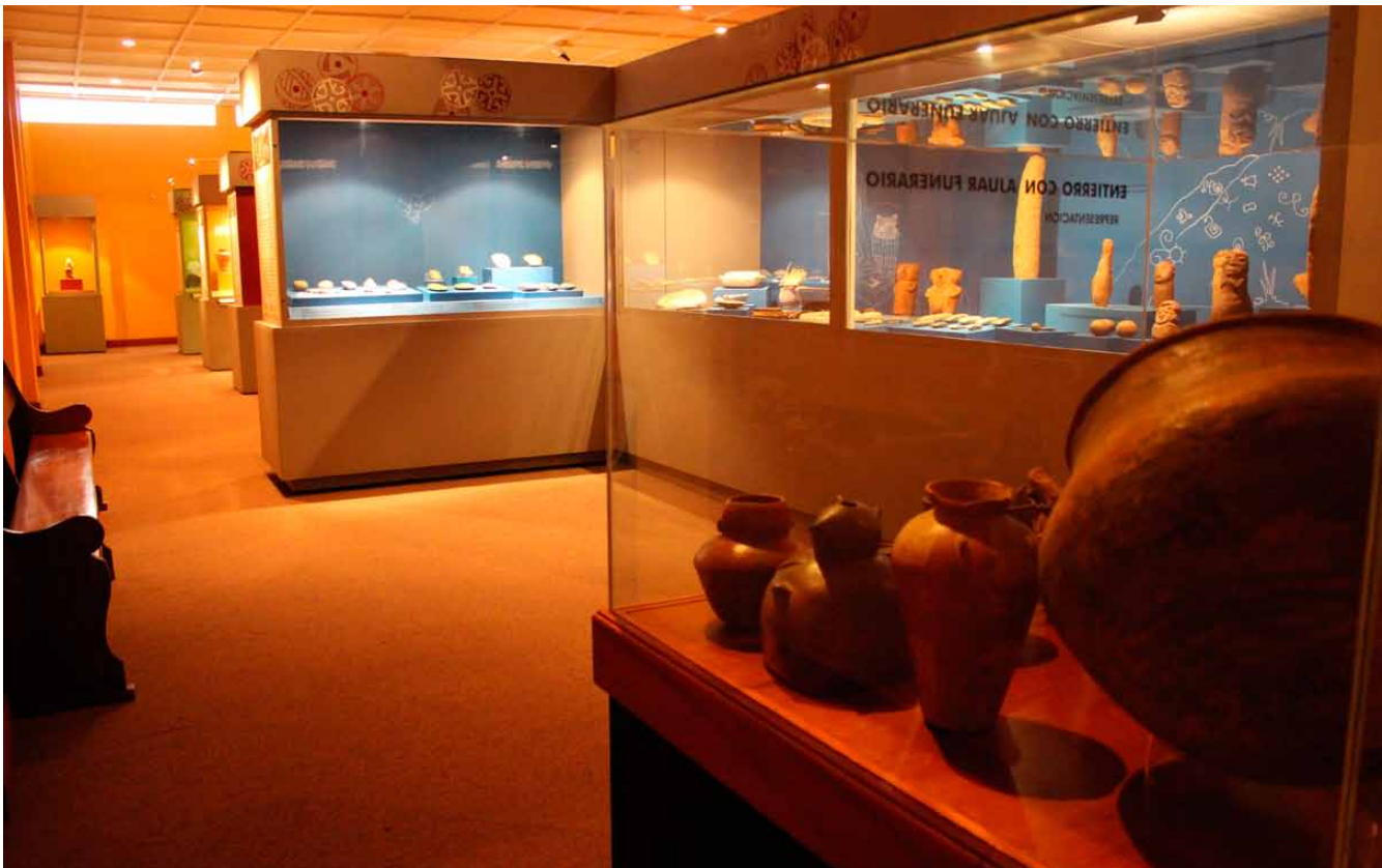
Sala de Arqueología

su habilitación como equipamiento cultural y posteriormente es adecuado de acuerdo a las necesidades particulares de cada colección y a los estándares inherentes del ámbito museístico y museográfico. Cuenta con cuatro salas de exposición, depósitos o reservas para cada colección, laboratorios, taller de restauración y áreas para actividades múltiples: auditorio, talleres para niños, entre otros.