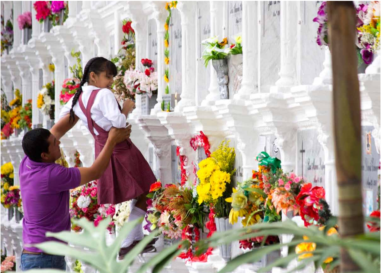
Visitantes del Cementerio Museo de San Pedro

El Cementerio Museo de San Pedro, cumplió 170 años el 22 de septiembre de 2012; actualmente es el cementerio más antiguo de la ciudad de Medellín y el único con declaratorias como museo de sitio y patrimonio cultural de la nación. Convirtiéndose en una institución con una amplia trayectoria a nivel nacional en la prestación de servicios funerarios y culturales.