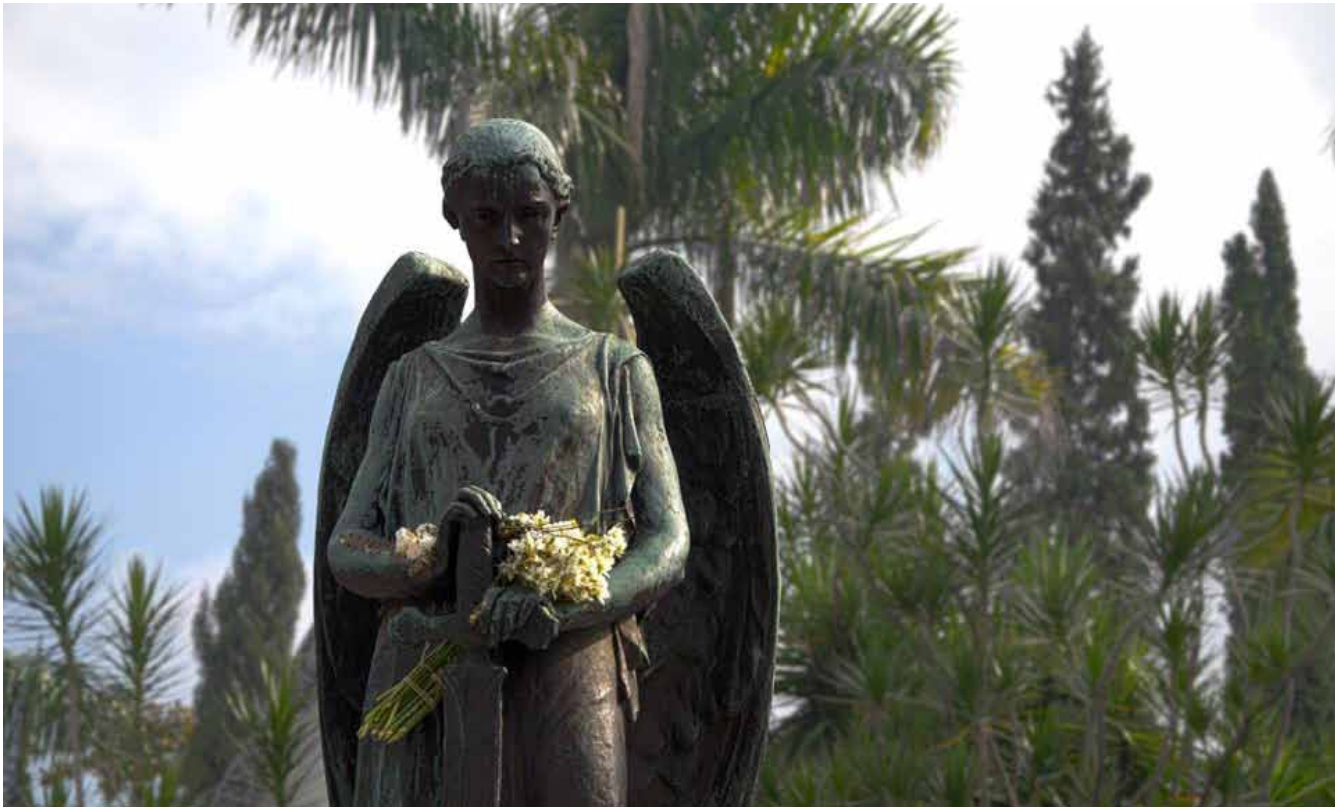
Cementerio Museo de San Pedro

lúdicas y sociales, abiertas a todos los públicos, lo que ha permitido que niños, jóvenes, adultos y adultos mayores, propios y extraños, se apropien de este lugar, como un espacio para la cultura, que narra su historia a partir de la colección funeraria más grande de la ciudad. El Cementerio Museo cuenta con una programación cultural constante; es un modelo único en Colombia de recuperación de cementerios patrimoniales, debido a su alto contenido de espacios lúdicos, culturales y pedagógicos, para la apropiación social del patrimonio.